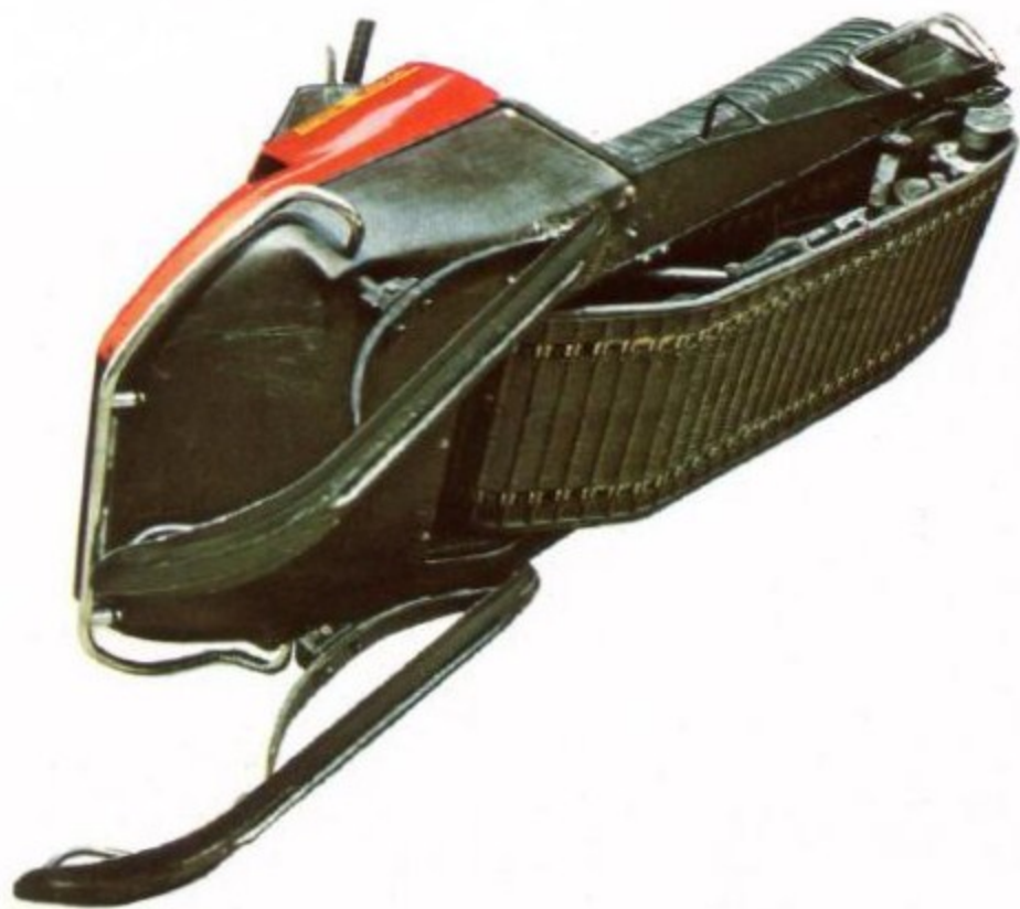
Cingolo completamente in gomma a disegno speciale. Larghezza cingolo cm. 46.

La Iso Automotoveicoli S.p.A. si riserva il diritto di apportare modifiche senza nessun avviso.